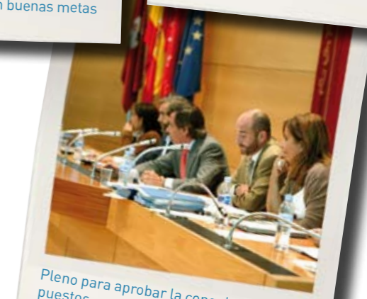
Pleno para aprobar la congelación de impuestos