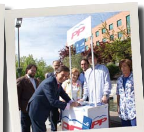
Recogida de firmas contra el IVA de ZP