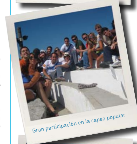
Gran participación en la capea popular